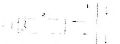
а - однотрубная система, стандартное подключение

в) Типовые схемы подключения отопительных приборов: