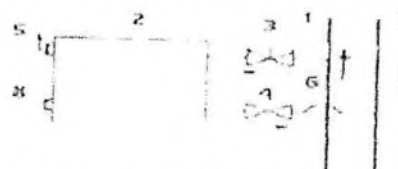
г - двухтрубная система, рекомендуемое подключение