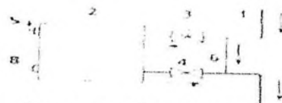
б - однотрубная система, подключение с перемычкой